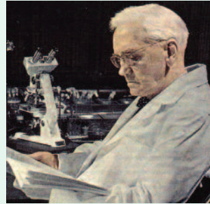
Σερ Αλεξάντερ Φλέμινγκ, (1881-1955) “Πατέρας της πενικιλίνης”. Νόμπελ Ιατρικής 1945