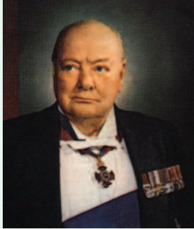
Σέρ Ουίνστον Τσώρτσιλ, Πρωθυπουργός Αγγλίας (1940-45, 1951-55), “Πατέρας της Νίκης” του Β' Παγκοσμίου Πολέμου.